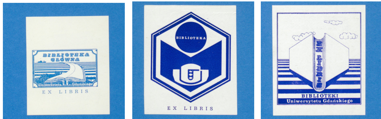
Pierwsze propozycje ekslibrisów dla Biblioteki Uniwersytetu Gdańskiego