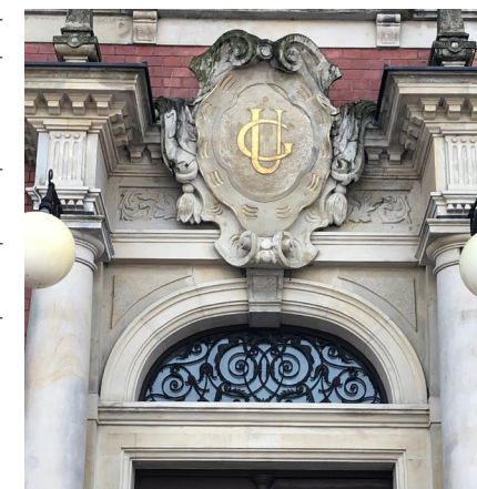
Znak Uniwersytetu Gdańskiego z lat 90. XX w. nad wejściem do Pałacu w Leźnie