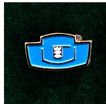
Przypinka Uniwersytetu Gdańskiego, lata 70. XX w. (zbiory MUG)